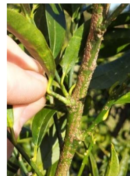
Figure 3 : type de rameaux prélevés pour les comptages

Un prélèvement aléatoire de 10 rameaux/modalité/bloc d'environ 10 cm (sur les deux arbres centraux) a été effectué. Les cochenilles du premier stade larvaire vivantes et mortes ont été dénombrées à la loupe binoculaire (Figure 3).